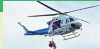
愛知県防災 航空隊職員派遣