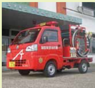
小型消防自動車 「ミニぼう」 株式会社 三和スクリーン銘板様 から寄贈 (令和2年)