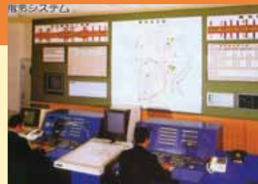
本庁舎東側の3階に増築した指令室