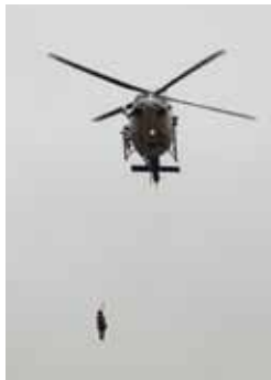
※写真は令和4年出初式のものです。