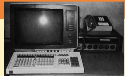
救急医療情報システム