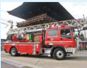
37m級はしご付消防自動車購入 (平成20年)