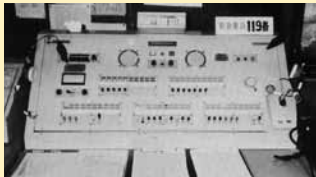
消防救急指令装置