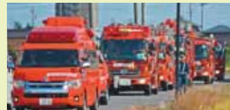
緊急消防援助隊 愛知県 大隊合同訓練