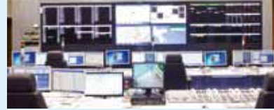
指令センター 指令台