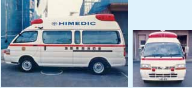
高規格救急車購入 (平成6年)