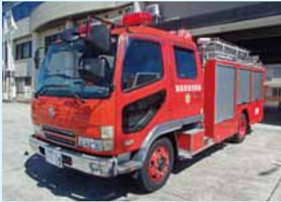
水槽付消防ポンプ自動車 (タンク容量2000ℓ)購入 (平成15年)