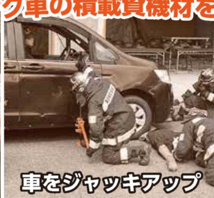
車をジャッキアップ