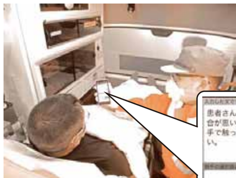
救急訓練でボイストラを使用している様子

この「A6」と書いてある救急車は、新型コロナウイルス陽性の方や陽性の疑いがある方を搬送する場合に、普段出動している救急車に替わって出動します。いわば、新型コロナウイルス対応救急車です(写真左)。車内はストレッチャーを専用のビニールで囲い、救急隊員の感染対策を行っています(写真中央)。出動後はオゾン発生装置を使用し、1時間程度の除染を行っています。オゾンには、コロナウイルスを不活化させ、感染力を低下させることが実証されています(写真右)。