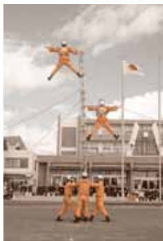
令和3年出初式風景

・普通救命講習I：成人への心肺蘇生法など・上級救命講習：成人、小児、乳児への心肺蘇生法など ※新型コロナウイルス感染症対策のため、講習の種類等が変更されることがあります。詳しくは、当組合ホームページをご覧ください。