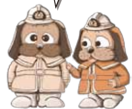
★消太(しょうた) & 消子(しょうこ)