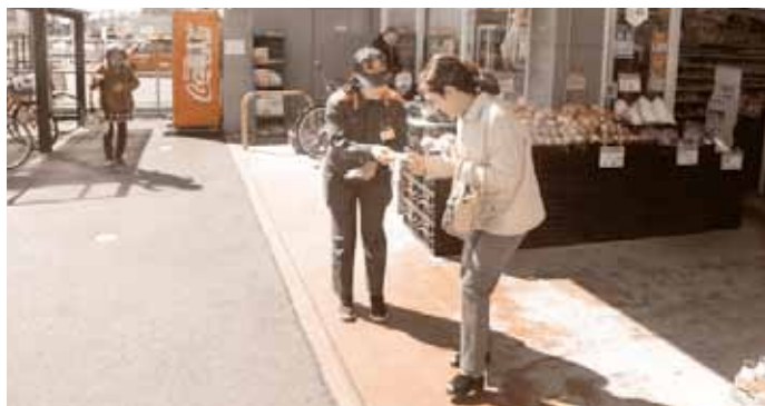
火災予防運動の街頭防火広報活動