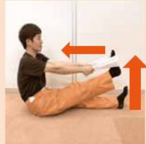
太もも裏のストレッチ

膝を伸ばしたままできるだけ高く足を上げることで、太もも裏を伸ばすことができます。