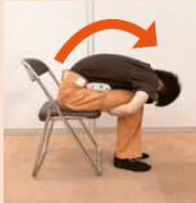
腰丸めストレッチ

大きめのタオルをおへその下に固定し、背中から腰に丸みを作り背面筋を伸ばすことができるストレッチです。