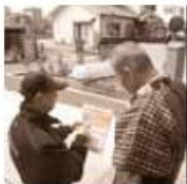
平成29年度秋の火災予防運動中の住宅防火訪問