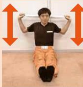
肩の上げ下げ運動

肩や肩甲骨の柔軟性を高める効果が期待できるストレッチです。肩こりの改善などにも効果が期待できます。