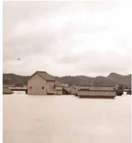
【活動場所付近の被害状況】