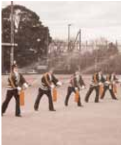
初期消火訓練の様子

ご家族、ご近所お誘い合わせのうえ、是非皆さまの地域を守る消防官の勇姿を見にお越しください。