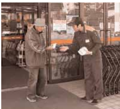
平成27年度 秋季火災予防運動の街頭防火広報活動

平成28年11月9日(水)から15日(火)まで秋季火災予防運動が全国一斉に実施されます。この運動は、火災の発生しやすい時季を迎えるにあたり、火災予防思想の一層の普及を図り、火災の発生を防止し、生命・身体及び財産を守ることを目的としています。特に、石油ストーブ等を使用する季節になりますので、ストーブ等の近くに燃えやすいものを置かないようにしてください。また、必ず火を消してから給油をしてください。