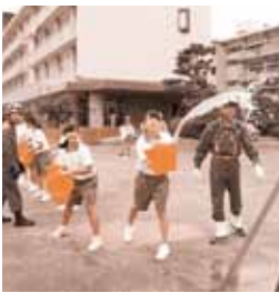
バケツリレーによる消火訓練