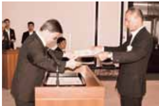
大村愛知県知事(左)と平野消防長(右)

平成28年8月10日(水)に、愛知県庁において「伊勢志摩サミット消防特別警戒に係る消防庁長官表彰」の伝達式が開催されました。この表彰は、伊勢志摩サミット開催期間中の平成28年5月24日(火)から29日(日)までに実施した、消防特別警戒体制の確立等に功労があった消防機関に対し、消防庁長官表彰が授与されるものです。