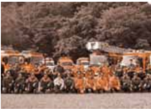
現地警戒本部にて

当組合からは、サミット会場周辺の現地警戒本部に化学車1台と消防隊員11名が出向し、24時間の交代勤務で各国首脳が宿泊する施設の警戒活動や高速道路での災害対応などの任務に就きました。