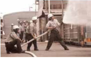
自衛消防隊による放水訓練

また、6月9日(木)に危険物安全週間の一環として合同訓練が実施され、防災意識の向上と消防署との連携強化に取り組みました。