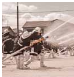
消防団の一斉放水訓練