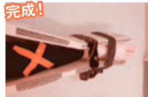
③完成です!時々、つま先の色等をチェックしましょう!