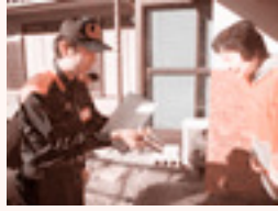
住宅訪問調査の様子

また、新築住宅や既存の住宅について、消防署の地図データを更新する目的で現地に出向し、建物の形や敷地の大きさ、表札での氏名確認等の調査を実施しています。いずれも消防行政において重要な業務であり、訪問の際は必ず 消防手帳を提示し、身分を明らかにして から行いますので、ご理解ご協力のほどよろしくお願いたします。