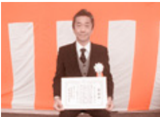
海部東部防火危険物安全協会様