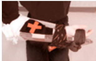
②ダンボールを腕に当てて、ネクタイやタオルで固定します。