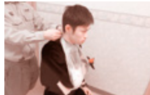
③固定した腕を①で空けた穴に通し、ビニール袋の手さげ部分を首の後ろで結びます。