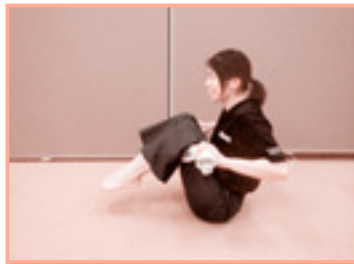
息を吸って、吐きながら両手でタオルを引き、膝を胸に近づけるようにする。息を吸いながら元の姿勢に戻る。