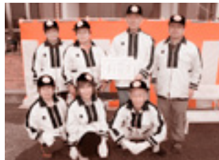
海部東部消防ボランティア様