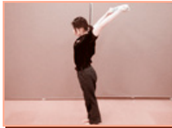
息を吐きながら、両腕を上げていき、できるだけ伸ばしたまま後ろに回す。息を吸って吐きながら両腕をはじめの姿勢に戻す。