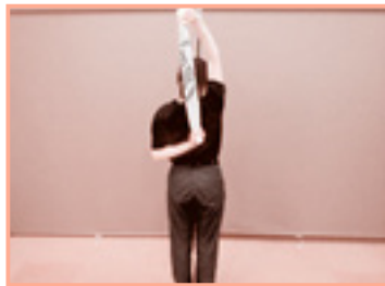
息を吸って、吐きながら右手でタオルを引いて、限界の部分で数秒間静止する。