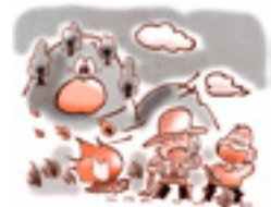
※野焼きは原則禁止されています。ご注意ください。

平成26年と比較すると3件減少しています。火災に至る経緯としては、昨年と同様、 たき火から目を離したすきに、周囲にあるものへ燃え移っています が、火災件数自体が減ったことは、 たき火から目を離さない と言った予防対策が浸透しつつあるのではないのでしょうか。予防対策を完全浸透させてたき火火災を無くしましょう!