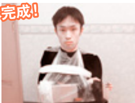
④最後にタオルを脇に通して腕と一緒に固定します。