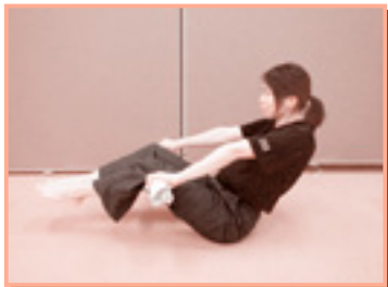
床に腰を下ろし、膝うらの少し上あたりにタオルを回し、両手でタオルを握る。次に両足を浮かせて安定させる。