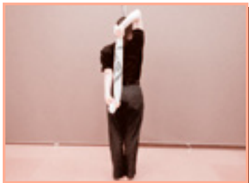
右手を上から、左手を下から背中に回し、タオルの両端を握る。息を吐きながら左手をゆっくり下へ伸ばしてタオルを引いて、限界の部分で数秒間静止する。