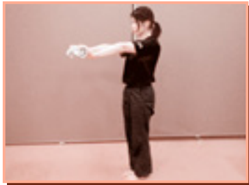
両手でスティックがわりに丸めたタオルの端を持ち、腕を伸ばして息を吸う。