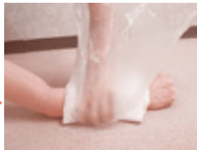
タオルとビニール袋を使用した固定法