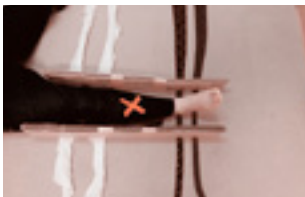
①脚の両側をダンボールで挟み込みます。この時、ネクタイを下に敷きます。