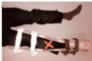
②変形部位が見えるようにネクタイ等で結んで固定します。