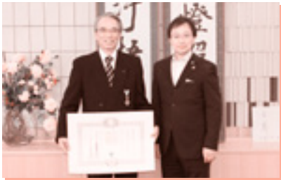
海部東部消防組合副管理者へ叙勲報告