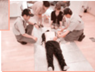
贈呈された救急資器材の展示