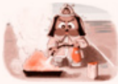
一斉放水訓練の様子