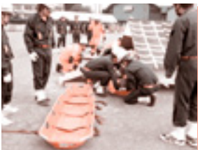
あま市総合防災訓練