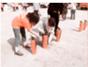
大治町総合防災訓練