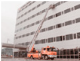
はしご車救助訓練