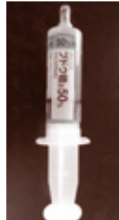
〈投与するブドウ糖〉