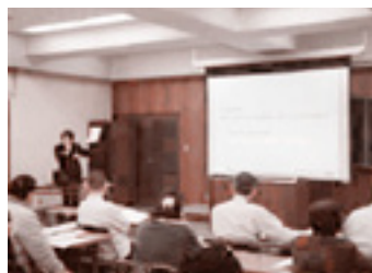
防火管理講習の様子

申込みには顔写真(4cm×3cm)と受講料2900円(テキスト代)が必要となります。