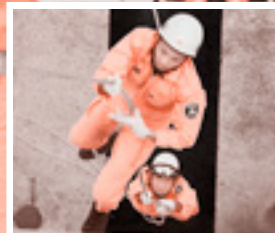
ロープ応用登はん