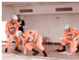
ロープブリッジ救出