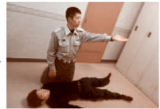
③ 119番通報とAEDを依頼する