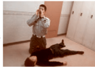
② 大声で叫び応援を呼ぶ