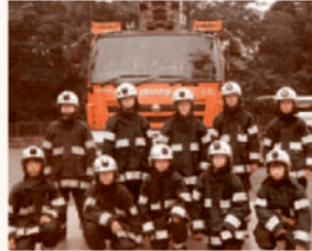
防火衣の着装体験