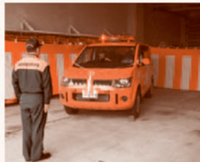
デモンストレーション