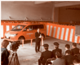
防災活動車披露式