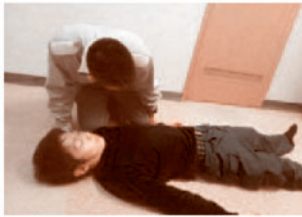
④ 普段通りの呼吸があるか観察する

胸や腹に動きがあるか観察する (確認に10秒以上かけないこと) 胸や腹に動きがなければ次に進む