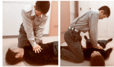
⑤ 胸骨圧迫を30回行う

胸の真ん中を、少なくとも5cm(小児は胸の厚さの3分の1) 沈み込むように強く速く絶え間なく、垂直に圧迫を繰り返す