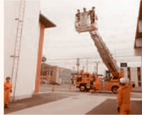
はしご車の乗車体験