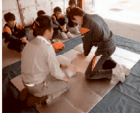
心肺蘇生法の訓練