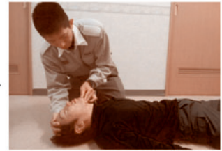
⑥ 人工呼吸を2回行う

胸の真ん中を、少なくとも5cm(小児は胸の厚さの3分の1) 沈み込むように強く速く絶え間なく、垂直に圧迫を繰り返す