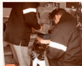
資器材点検及び整備

同じく1月には、高規格救急車が新たに導入されました。みなさんのニーズにお応えするため、最新の資器材を搭載し、出場に備えます。