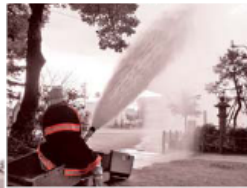
自衛団による放水