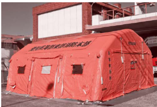
テント本体サイズ 幅6m×奥行6m×高さ3m

このテントは災害時に使用することを前提に 作られており、素早く数分で設置できること、 4人で移動が可能なこと、安定性がよく堅牢で 丈夫であること、長期にわたり抗菌、防カビ性 を維持できることを特徴としています。また、 テント内は、医療用点滴、照明器具等が取り付 けられる構造となっており、災害現場での応急 処置等をより効果的に実施することが可能と なります。